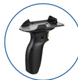
一/二维 扫描头手柄